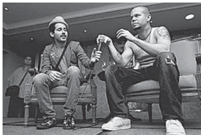
Ellos son el mejor dueto reguetonero.