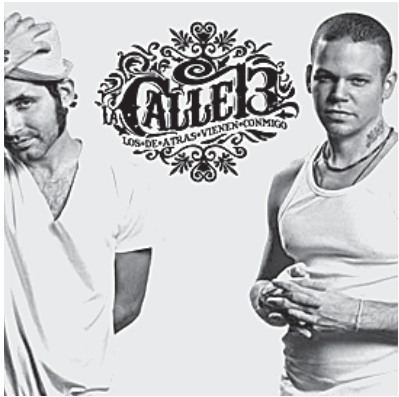
Viernes once de marzo plaza de toros monumental de Morelia, Calle Trece.

Este viernes en la plaza de toros monumental de Morelia a partir de la ocho se presentara el grupo reguetonero que esta causando sensación en toda la republica mexicana Calle Trece, los presenta promociones Sola-che y hay una gran expectación por su presencia en esta capital michoacana, ya que se trata de una de los mejores duetos que se han formado durante los últimos años.