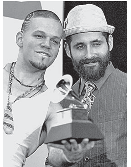
Por primera vez en esta capital los presenta Sol-hache producciones.

Después de alcanzar fama, Calle 13 se ha convertido en uno de los más solicitados por otros artistas de reggaeton y han colaborado con algunos de ellos, cantando o co-escribiendo canciones fue durante el mes de abril de 2007 editan su segunda placa bajo el título de "Residente o Visitante". El primer sencillo se titula "Tango del pecado" en el que fusionan el tango con el reggaeton. Un año después lanzan "Los de atrás vienen conmigo". Para este tercer disco, aparecen nombres muy importantes como colaboradores, entre ellos el mítico Rubén Blades que participa en la canción "La Perla", dedicada