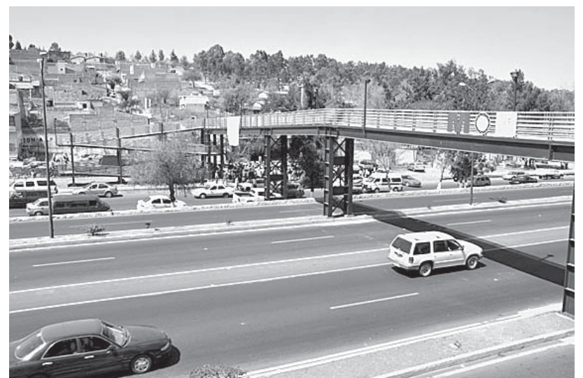
En gira de trabajo por el oriente de la capital y tras entregar tres obras de pavimentación y un puente peatonal por 3.7 millones de pesos, el presidente municipal Fausto Vallejo Figueroa dejó en claro que la administración que encabeza no hace obras por capricho, sino en aquellos sitios donde verdaderamente se necesitan, sobre todo en colonias populares y el medio rural.